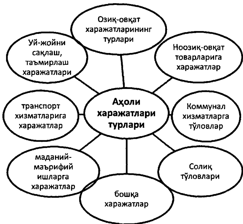
2.2-расм. Аҳоли харажатларининг асосий турлари