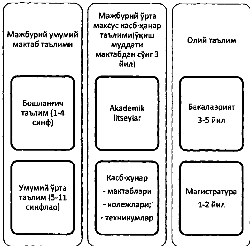
3.1-расм. Ўзбекистон Республикасида 2019 йилгача фаолият кўрсатган таълим тизими

Мамлакат Президенти Ш.Мирзиёев 2020 йил 30 сентябрдаги ўқитувчи ва мураббийлар кунига бағишланган тантанали маросимдаги нутқида ҳақли равишда “Бир ўйлаб курайлик, дунёдаги ривожланган давлатлар қандай қилиб юксак тараққиёт ва турмуш фаровонлигига эришмоқда? Деб савол қўйди ва ўзи бу саволнинг жавоби таълим ва тарбияда эканлигини таъкидлади, “ҳаммамизга аёнки, тараққиётнинг тамал