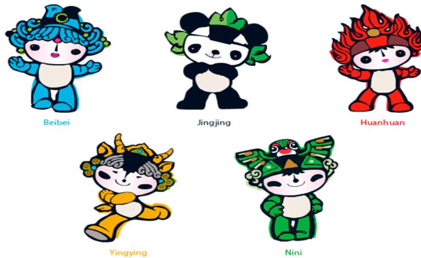
7-rasm. Pekin-2008 Olimpiya o‘yinlarining talismani.

o‘yinlarga mezbonlik qilayotgan davlat tomonidan tanlanadi. Olimpiya o‘yinlari talismani hayvonlar va boshqa narsalardan tanlab olinadi.