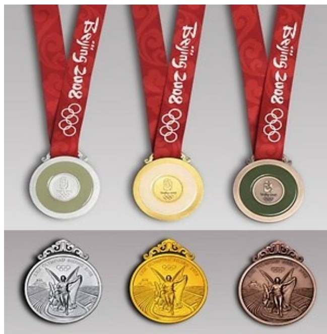
6-rasm. Olimpiya medallari.

Bundan tashqari I Olimpiya o‘yinlaridan boshlab Olimpiya kuboglari beriladi. Ular ayrim shaxlar yoki davlat arboblari tomonidan ta’sis etiladi. I Olimpiya o‘yinlarida akademik Mishel Breal o‘z Olimpiya kubog‘i mukofotini marafon musobaqalari g‘olibiga bergan.