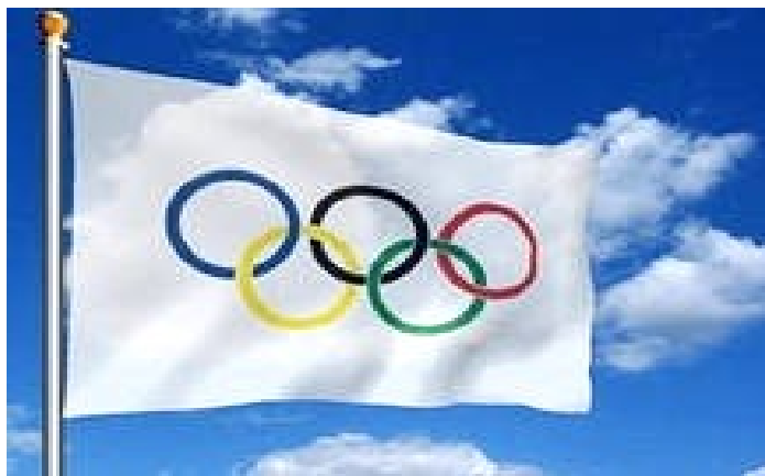
5-rasm. Olimpiya bayrog‘i.

Olimpiya shiori – (lotincha) “ itius, Altius, Fortius ” – “Tezroq, Kuchliroq, Balandroq” so‘zlarini ifodalaydi (Olimpiya xartiyasi, 10-modda). 1896-yilda Kuberten tomonidan shior kiritilgan.