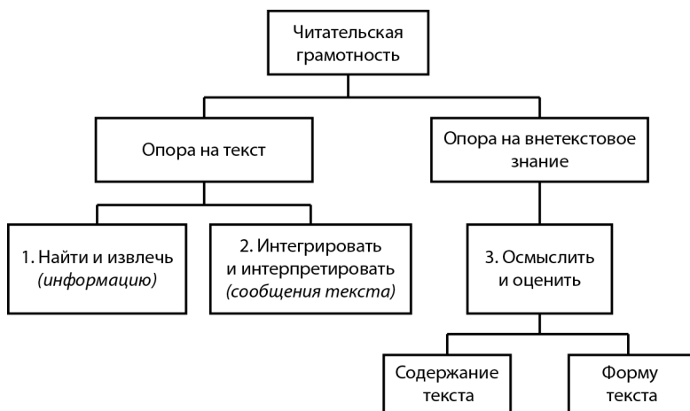
Рис. 2. Читательская грамотность (по слайду Г.А. Цукерман)

Согласно определению PISA: читательская грамотность — способность человека понимать и использовать письменные тек-